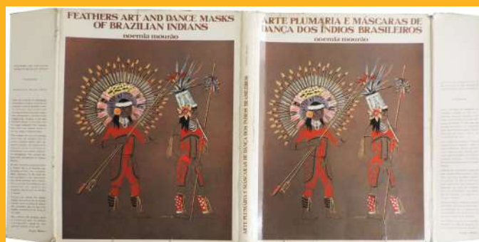
Sobrecaixa do livro Arte Plumária e Máscaras de Dança dos Índios Brasileiros, de Noemia Mourão, impressas nas oficinas de Artes Gráficas Brasdesco, São Paulo, 1971.