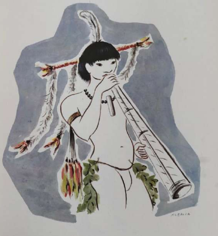
Estampa 58. Índio Tuiuca. Apresentando grande enfeite de cabeça, da qual caem grandes pingentes ornamentais. Braçadeira com longo pingente de penas de arara e papagaio. Da cintura pendem dois ramos de fôlhas. Colar de contas de sementes e cilindro de quartzo polido. Acompanha uma flauta. Reprodução do livro Arte Plumária e Máscaras de Dança dos Índios Brasileiros , de Noemia Mourão, impressas nas oficinas de Artes Gráficas Bradesco, São Paulo, 1971.

Mourão, foi pensado como o primeiro livro de uma série consagrada às manifestações das artes visuais brasileiras. A introdução foi escrita por Gilberto Freyre. Nele constam 70 pranchas coloridas, no tamanho 37 x 52 cm, mapas e descrições sobre as tribos representadas. Foi produzido em papel offset e apresentado em duas versões: encadernado e em folhas soltas, impressas nas oficinas de Artes Gráficas Bradesco, totalizando 300 exemplares numerados e assinados pela artista. Também foi realizada a versão para língua inglesa, visto que havia a perspectiva de ser lançado também em Paris, Nova Iorque, Roma e Londres. A intenção de Noemia Mourão era divulgar a riqueza plástica da indumentária de algumas tribos indígenas brasileiras. Seus desenhos possuem traços leves e modernos, característicos das gravuras que produzia.