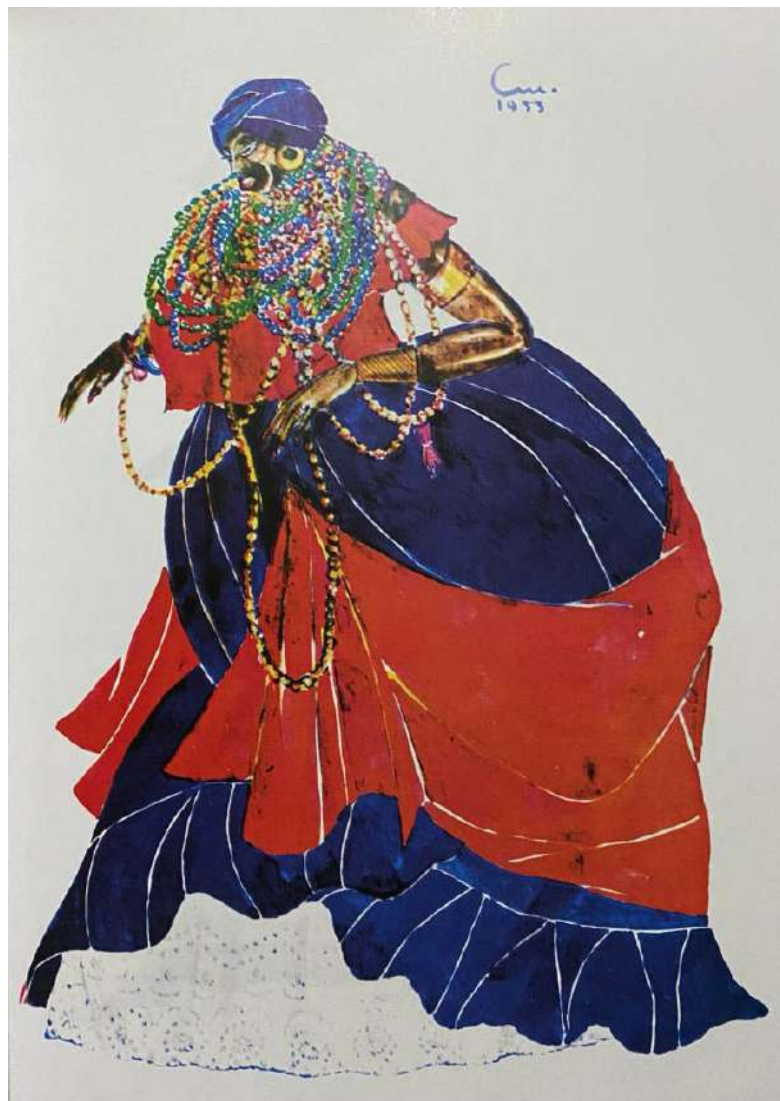
Baiana. Aquarela e grafite sobre papel, ass., 1933, 26,5x36,5cm. Reproduzida no livro Batuque, samba e macumba: estudos de gesto e de ritmo , 1926-1934, de Cecília Meireles, publicado pela FUNARTE e patrocinado pelo Crefisul, Rio de Janeiro, 1983. p. 29.