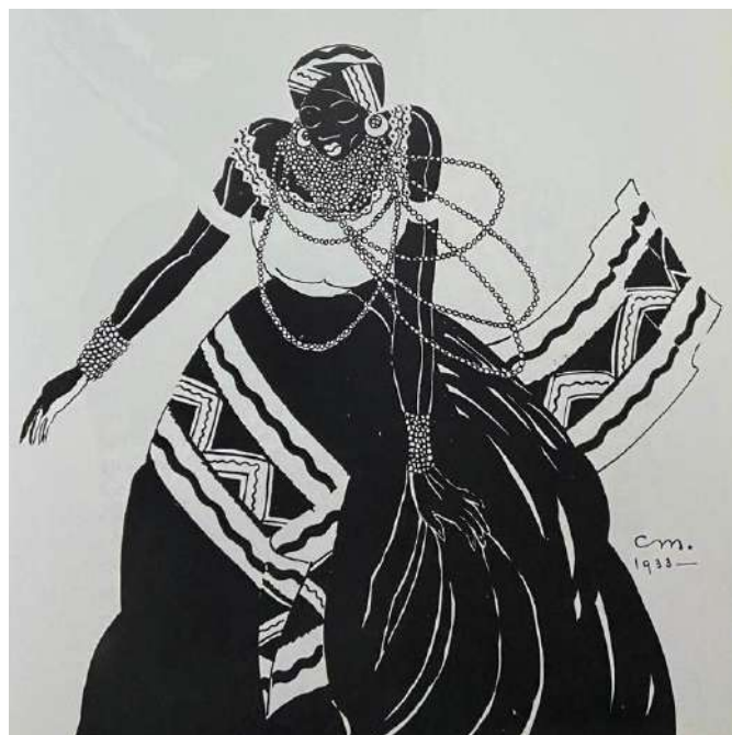
Baiana. Nanquim e grafite sobre papel, ass., 1933, 31x30cm. Reproduzida no livro Batuque, samba e macumba: estudos de gesto e de ritmo, 1926-1934 , de Cecília Meireles, publicado pela FUNARTE e patrocinado pelo Crefisul, Rio de Janeiro, 1983. p. 23.

Cecília Meireles publicou o livro Batuque, samba e macumba: estudos de gesto e de ritmo , 1926-1934, pela primeira vez, em 1983. Trata-se de uma coletânea de desenhos produzidos por ela entre 1926 e 1934, que retratam negros e negras com suas vestimentas, acessórios e objetos típicos, em referência à ancestralidade africana dos mesmos, tanto no contexto do carnaval quanto no do cotidiano da cidade do Rio de Janeiro, local onde ela vivia. Expressivos e com traços modernos, os desenhos de Cecília Meireles foram expostos pela primeira vez na Pró-Arte, no Rio de Janeiro, em 1933, mesmo ano em