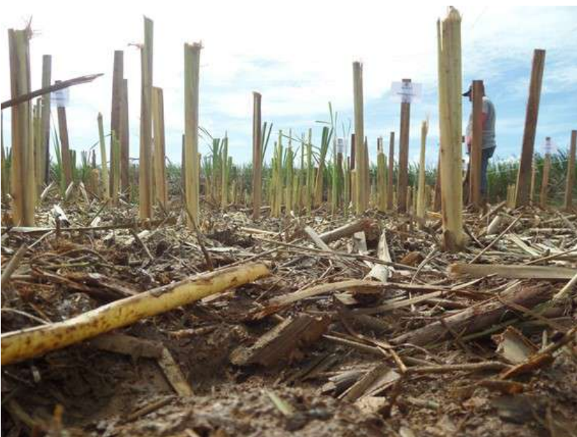
Figura 2. Mudanças de taboa ( Typha domingensis ) cultivadas no estuário do Rio Doce para remediação de elementos potencialmente tóxicos no solo.